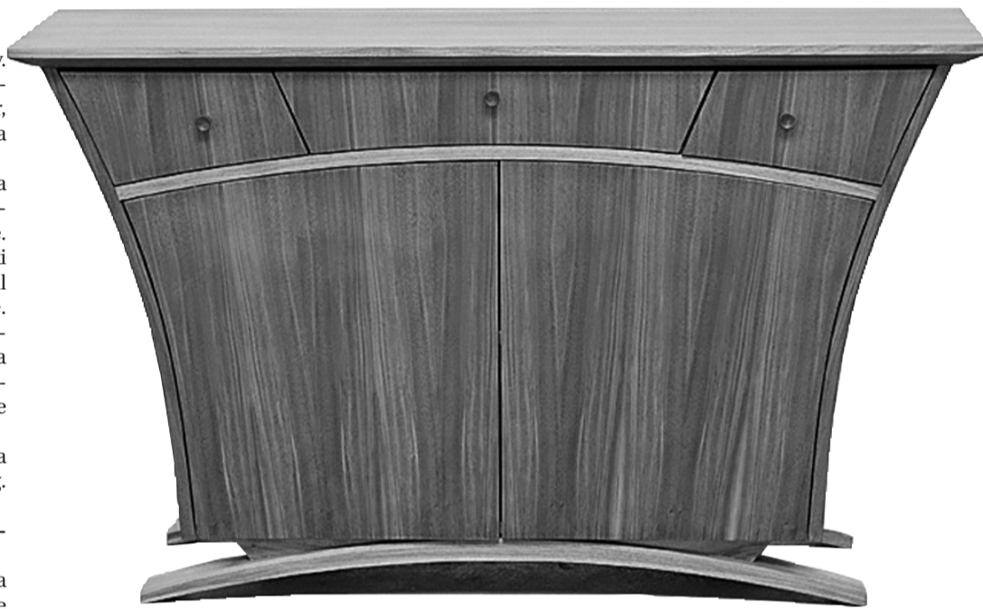
Disainiauhinnale Bruno kandideerinud kapp „Lee“ kannab endas mõningast rahvusromantilise juugendi vaimu.

Tool „Isakaru“ on ootamatult pehme mööblitükk – nii siidiselt viimistlusel kui ka kehakumerusi järgiva seljatoetõttu.